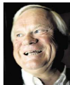
der Schifffahrtsbranche beteiligt. Es waren rein finanzielle Investitionen, die er

Fredriksen hat sich immer wieder an Unternehmen in