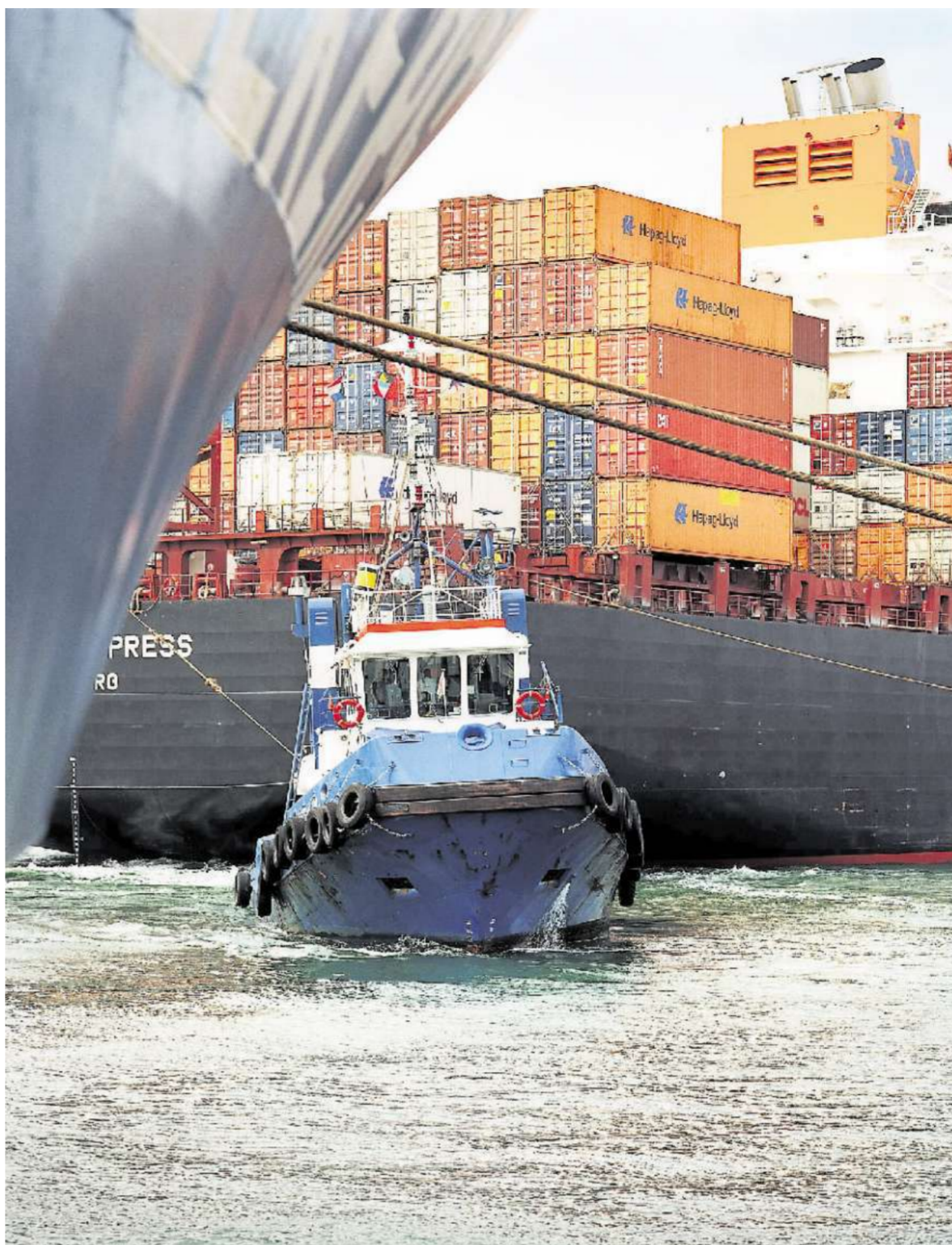
Die Schifffahrtstochter Hapag-Lloyd sollte Schwankungen im Tourismusgeschäft ausgleichen.

Doch auch die anderen Kontrolleure sind Frenzel gegenüber alles an-